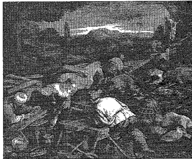
"LA COSTRUZIONE DELL'ARCA" In mostra il dipinto sarà affiancato da incisioni di tema biblico, che costituiscono un vero e proprio filone.

Intanto a Bassano prosegue con successo la grande rassegna per i 500 anni dalla nascita del maestro.