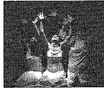
"IL SANGUE DEGLI ALTRI" parte dai libri di Simone De Beauvoir

Il primo spettacolo, alle 20, sarà seguito da due repliche, alle 21.15 e alle 22.30. Per ognuno sono disponibili solamente 30 posti; prenotazione obbligatoria allo 0444/322525; costo del biglietto 10 euro.